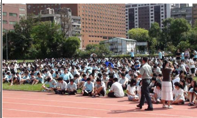
第三階段：同學在學校操場集合情形