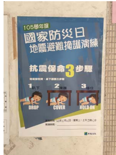
張貼中廊海報：演練動作重點及公告