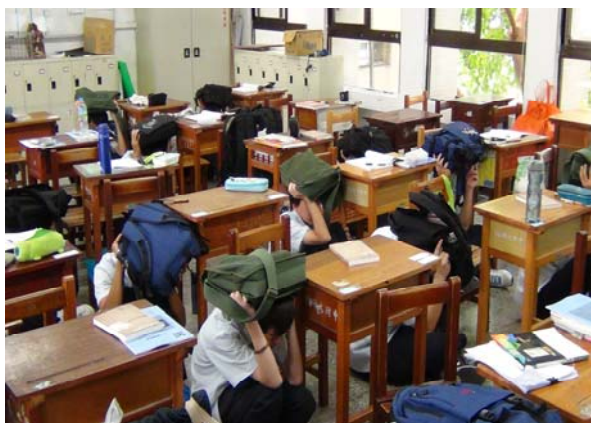
第一階段：就地掩蔽