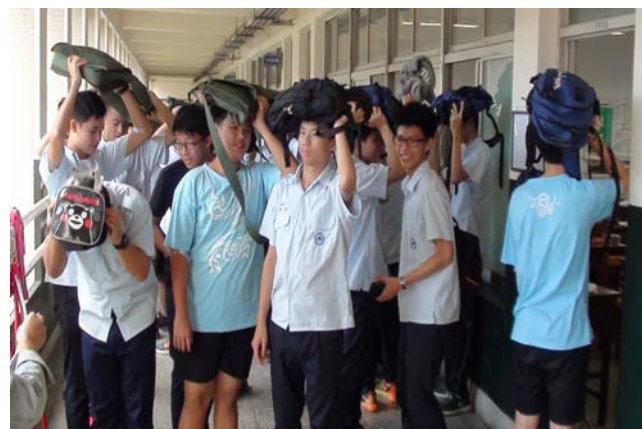
第二階段：疏散至操場