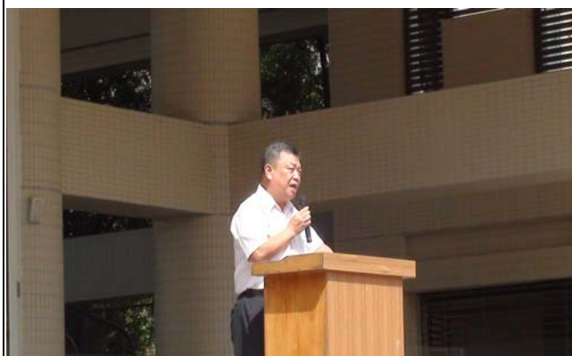
第三階段：校長致詞